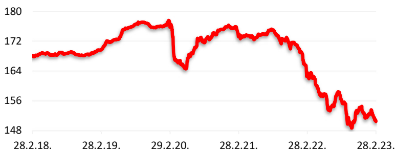
Kretanje cijene udjela HPB Obvezničkog fonda

Volatilnost (godina dana): 2,51% Sharpe-ov omjer: -0,12 Modificirana duracija: 4,02